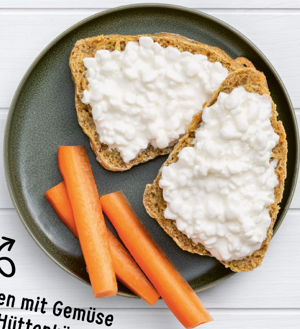
↻ Brötchen mit Gemüse und Hüttenkäse