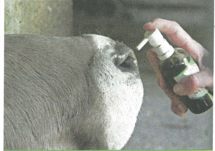
Le respect de l'animal exige des précautions.