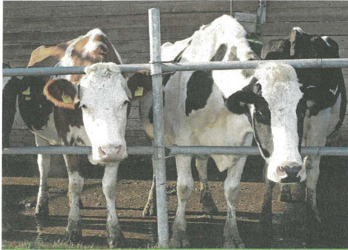
Facteur de réussite: une évaluation objective.