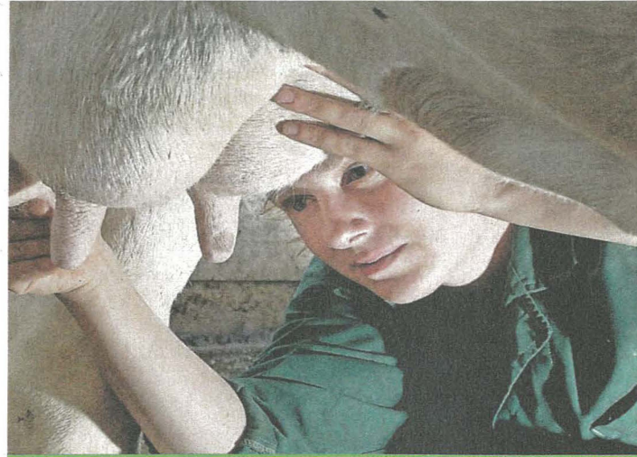
Phytolacca est le remède des glandes.