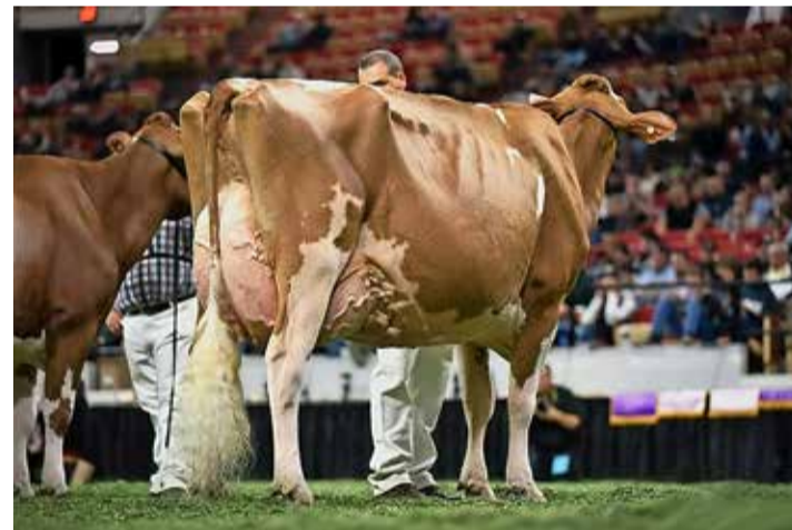
Highcroft Lily est nommée grande championne ainsi que championne du pis Red Holstein.

PETER FANKHAUSER, BAUERNZEITUNG. TRANSDUCTION ET ADAPTATION SABINE GUEX