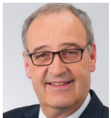
Conseiller fédéral Guy Parmelin

«Les pistes de solutions volontaires des acteurs du marché valent mieux que les interventions et les directives de la Confédération. Le Réseau suisse pour le soja devrait encourager à faire de même dans d'autres marchés.»