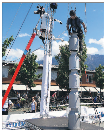
An Sommeranlässen erreicht das Swissmilk-Marketing über eine Million Besucherinnen und Besucher.

macher gab sie an den diversen Ständen ihr Bestes, wurde viel beachtet und vielfach geehrt. Die Besucher konnten am «Hau den Lukas» ihre Kräfte messen. Ein weiterer sportlicher Höhepunkt findet vom 30. August bis am 1. September in Burgdorf statt: Am Eidgenössischen Schwing- und Älplerfest wird die Tradition hochgehalten, und was passt besser dazu als das Getränk aus dem Alpenland Schweiz? Dass Milch stark macht, wissen nicht nur Schwingerkönige, es ist dem Publikum dank dem Swissmilk-Marketing mittlerweile ebenfalls bestens bekannt.