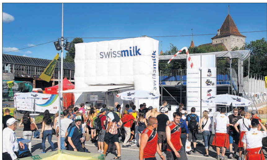
Schweizer Milch ist ein natürlicher Fitmacher. Sie hilft mit, sich nach dem Sport wieder zu erholen. Aber nicht nur für Turnende gilt: Täglich 3 Portionen Milch sind wichtig für eine gesunde Ernährung.