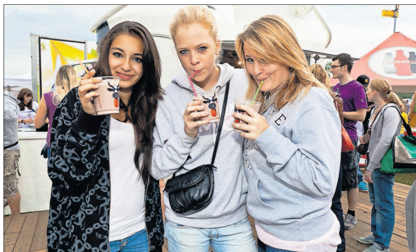
An Openairs und Festivals zeigt sich die Milch von ihrer jugendlichen Seite, um die Aufmerksamkeit der zukünftigen Konsumentinnen und Konsumenten zu wecken.