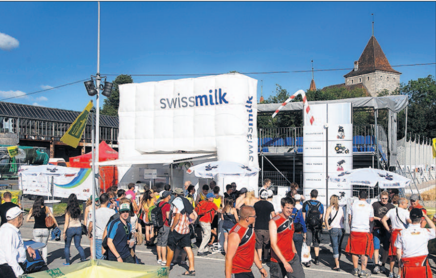
Le lait suisse est un fortifiant naturel. Il aide à récupérer après le sport. Pour les gymnastes comme pour tout le monde: une alimentation saine comprend trois produits laitiers par jour.