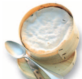
Vacherin Mont-d'Or AOC