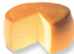
Fromage à pâte mi-dure (Mutschli)