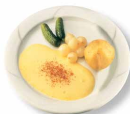
Fromage à raclette