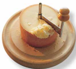
Tête de Moine AOC