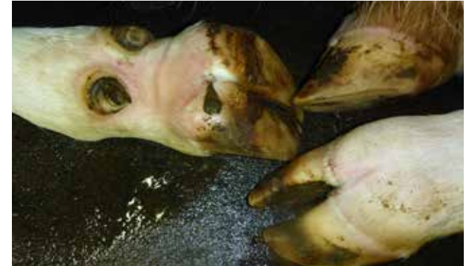
Hochgradig entzündlich veränderte Klauen verursachen Lahmheit und Festliegen

Unter den in der Schweiz üblichen hygienischen Bedingungen besteht für den Verbraucher von Milch, Milchprodukten und Fleisch auch im Falle einer Einschleppung der MKS in die Schweiz oder in das benachbarte Ausland keine Gefahr. Milch und Fleisch aus Ausbruchsbetrieben würde zudem gar nicht auf den Markt gelangen.