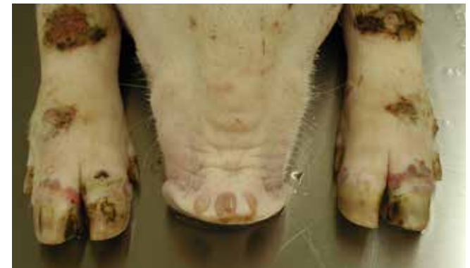
Rüsselscheibe eines infizierten Schweins mit flüssigkeitsgefüllter Blase