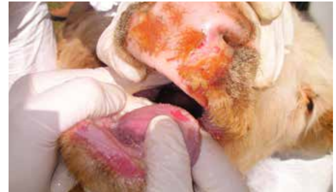
Rinderzunge mit Blasen (Aphthen)