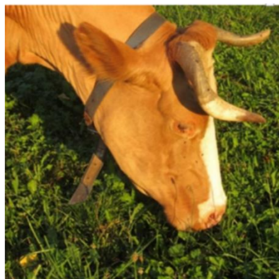
Figure 1 : La vache Swiss Fleckvieh Berge, plus vieille vache du troupeau du FiBL

Les vaches réformées ou périées sont attribuées à l'exploitation dans laquelle la vache a vêlé pour la dernière fois. Si le dernier vêlage a eu lieu dans une exploitation d'estivage ou de pâturages communautaires, la vache est attribuée à l'exploitation dans laquelle elle se trouvait avant ce vêlage (art. 37 chiff. 7 et 8 OPD).