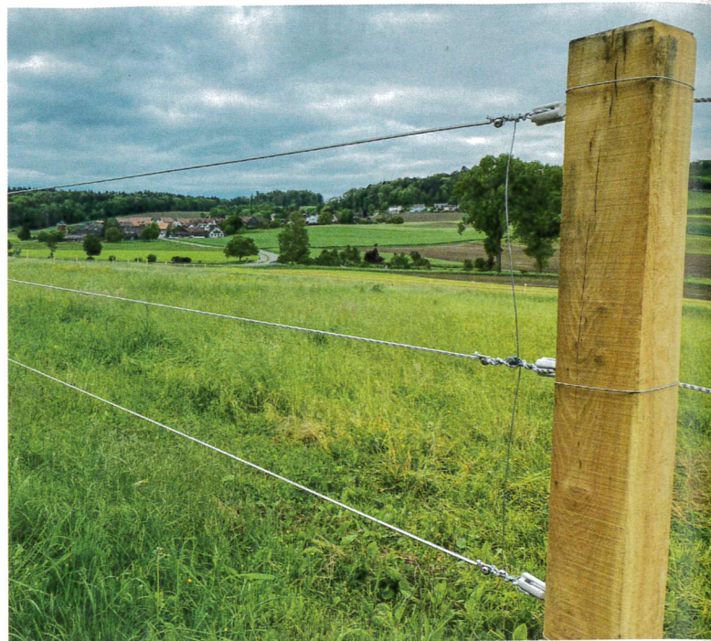
Einmal richtig gebaut, halten Zäune Jahrzehnte: Feste Zäunung einer Pferdekoppel in Niederhasli im Kanton Zürich

Den richtigen Zaun für die jeweilige Situation auszuwählen ist eine komplexe Angelegenheit, vor allem dann, wenn man alle Interessen ausgewogen berücksichtigen möchte. Wer seine Tiere auf Wiesen mit hohem Konfliktpotenzial weiden lässt, ist mit einer professionellen Beratung auf der rechtlich sicheren Seite – vor allem, wenn es in Richtung Dauerweide