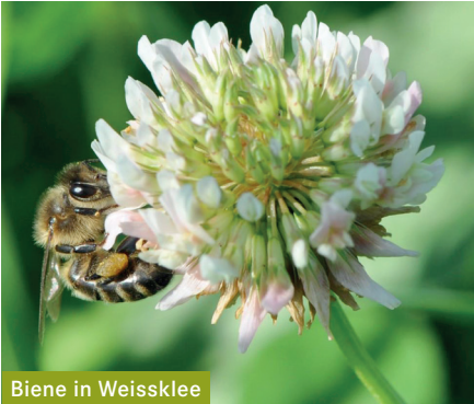
Biene in Weissklee

Beim Einsatz des Mähaufbereiters beträgt der Verlust von Honigbienen zwischen 35-62 % .