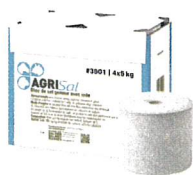
Salz-Leckstein mit Iod 4 x 5 kg #3901

Natürliches oder mit Spurenelementen angereichertes Salz, um den Bedürfnissen jedes Tieres gerecht zu werden.