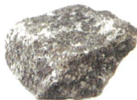
Naturleckstein aus Armenien 20 kg #3021