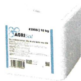
Salz-Leckstein mit Iod 10 kg #3906