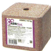
Fruchtbarkeitsstein 10 kg #3905