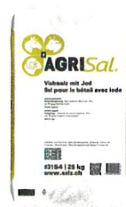
Viehsalz mit Iod 25 kg #3154