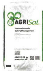
Futtermittelsalz 25 kg #3482