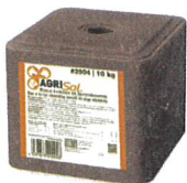
Mineral-Leckstein mit Spurenelementen 10 kg #3904