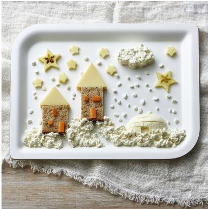
Tableau hivernal comestible