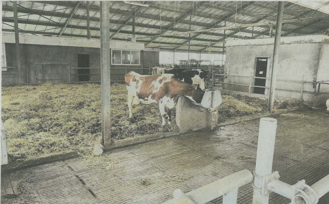
Une zone de vêlage et de démarrage sur paille profonde aux Pays-Bas.

Répondons à la question posée ci-dessus: une vache Holstein de 650 kg et 145 cm de hauteur au garrot mesure environ 2 mètres de la base de la queue à la patte avant repliée. Avec la tête, il faut ajouter 70 cm et pour se lever, où elle pousse la tête vers l'avant pour prendre son élan, elle a besoin de 75 cm supplémentaires. De nombreuses logettes ne répondent pas à ces dimensions. Les vaches apprendront à se coucher dans les lits trop