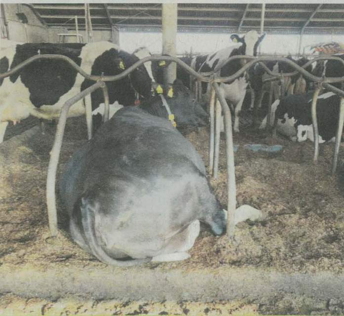
Barre de nuque à la bonne hauteur et arrêtoir au milieu. Les vaches ne peuvent pas se coincer (écurie aux Pays-Bas).