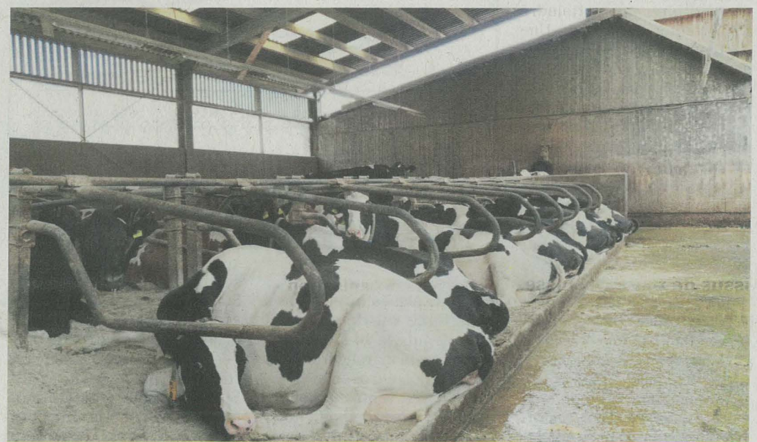
DR Des logettes confortables mais la barre de nuque est basse et l'espace entre les logettes est restreint, les vaches sont très proches avec leurs têtes.