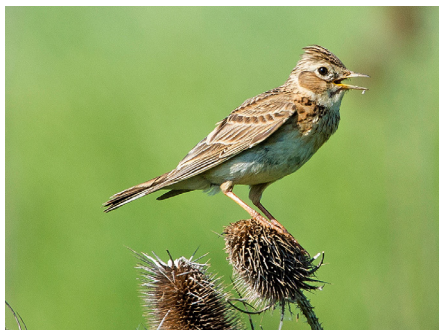
Alouette des champs

Une fauche tardive, comme dans le cas des SPB (après la mi-juin en plaine et après la mi-juillet en montagne), offre à diverses espèces de papillons et d'oiseaux nicheurs la possibilité d'achever leur développement. De plus, la plupart des graminées et fleurs des prairies ont le temps de disséminer leurs graines, contribuant ainsi à la conservation et à la promotion de la biodiversité végétale.