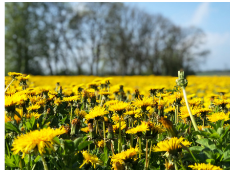
Prairie de pissenlits

Selon la météo, il peut arriver que seulement peu d'insectes volent pendant la journée. C'est par exemple le cas lorsque le nectar s'évapore parce que le temps est chaud et qu'il y a un léger vent. Ces conditions sont par ailleurs aussi idéales pour le séchage du fourrage. Par sécurité, mieux vaut observer: N'utilisez le conditionneur que lorsqu'il y a clairement moins d'une abeille par m 2 . 4 Il est toujours possible de faucher avec la barre de coupe - il existe des machines modernes pour ce faire.