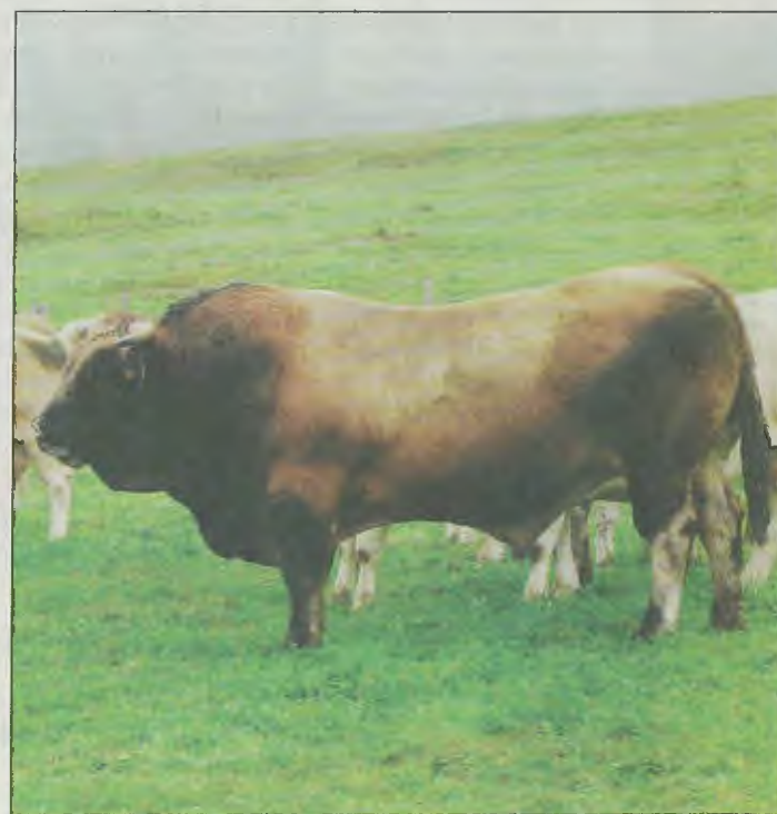
Bei Stieren genügt das geführte Bewegen zum Decken nicht zur Erfüllung des Bewegungsanspruches.