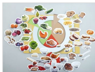
Le modèle d'assiette de Swissmilk (alimentation sur mesure)

La préférence donnée au modèle de la SSN est expliquée surtout par son fondement scientifique et sa recommandation officielle. Le modèle de Nestlé est quant à lui privilégié surtout en raison de sa clarté visuelle. Le modèle d'assiette de Swissmilk est utilisé par environ une personne interrogée sur douze, une des raisons invoquées étant sa flexibilité.